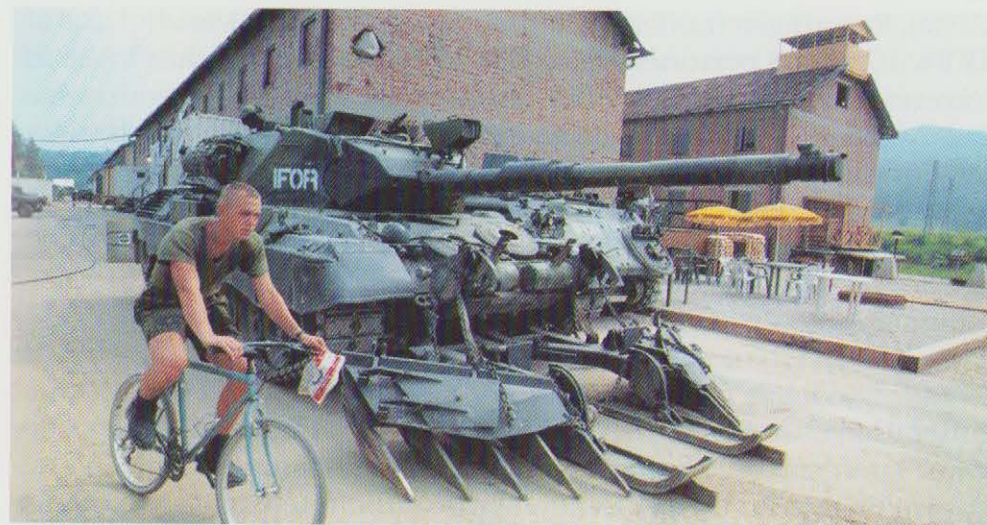
Hverdag i Camp Dannevirke i Bosnien-Hercegovina.

6.-8. maj: Forsvarsministeriet afholder i samarbejde med Forsvarskommandoen og Forsvarets Bygningstjeneste et miljøseminar for repræsentanter for det tjekkiske forsvarsministerium.