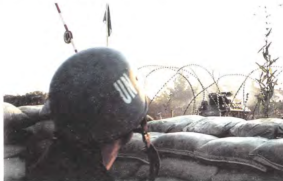
De seneste års erfaringer har vist behovet for hurtig reaktion. FN's generalsekretær har fremhævet, at planlægningen af FN-operationer skal gøres mindre ad hoc præget.

FN's generalsekretær fremhævede i rapporten »Fredens Dagsorden« fra januar 1992, at planlægningen af FN's fredsbevarende operationer måtte gøres mere effektiv og mindre ad hoc præget. Generalsekretæren pegede samtidig på behovet for styrker til FN's rådighed, der kan indsættes hurtigt i krisesituationer.