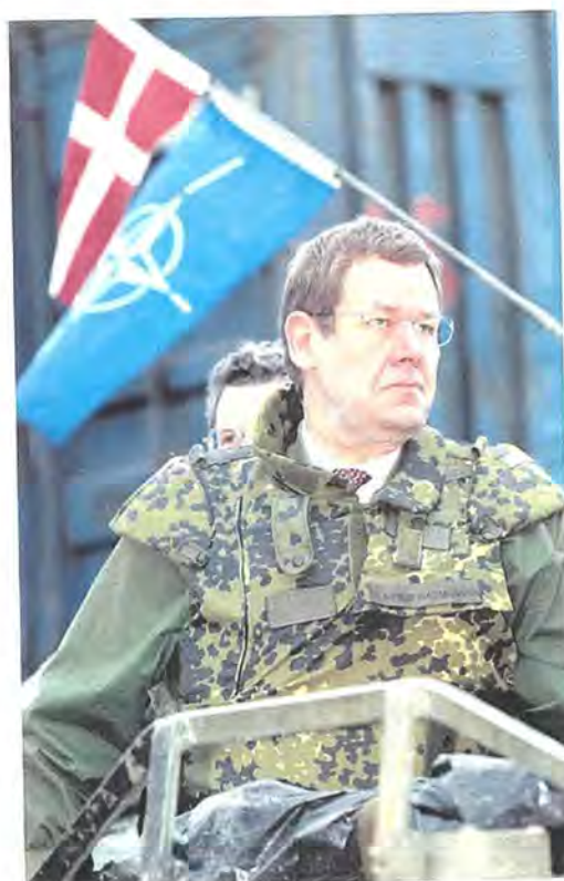
IFOR afløstes i december 1996 af en mindre styrke kaldet SFOR. Under sit besøg i Bosnien i oktober fremhævede statsminister Poul Nyrup Rasmussen, at IFOR havde gjort en afgørende forskel i det tidligere Jugoslavien. Statsministeren udtrykte samtidig stor anerkendelse af de danske enheders indsats.

Valgene gav som ventet et præsidentskab for Bosnien-Hercegovina bestående af præsidenterne for de tre parter: Præsident Izetbegovic (muslim), der blev præsidentskabets første formand, præsident Plavsic (bosnisk serber) og præsident Zubak (bosnisk kroat). Efter svære indledende forhandlinger kunne det fælles politiske arbejde mod endelig fred i Bosnien-Hercegovina begynde i starten af oktober måned.