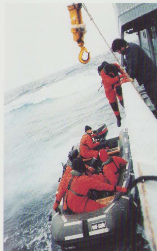
Kontrolhold klargør til inspektion af trawler ved Grønland.

23. maj: 3. afdeling (Internationale spørgsmål) oprettes i Forsvarsministeriet. Den nye afdeling består af 7. kontor, (NATO og sikkerhedspolitiske spørgsmål), 8. kontor (Samarbejde med Norden samt Central- og Østeuropa) samt KNV-sektionen (Konfliktforebyggelse, Nedrustning og Våbenkontrol).