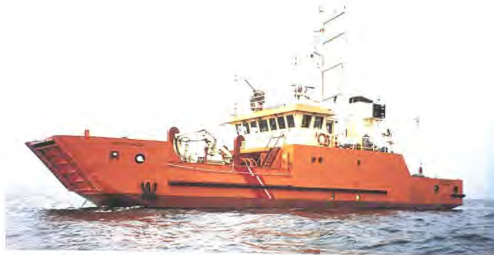
Den maritime miljøovervågning og forureningsbekæmpelse hører under Forsvarsministeriet. Samtidig overvejes det nu at etablere en miljømæssig flyovervågning i Forsvarsministeriets regi. Mette Miljø klar på feltet.

Som tredje trin er der i forbindelse med EU-direktiv om meldepligt for skibe, som transporterer farligt eller forurenende gods i fællesskabets havområder, indgået aftale om etablering af et meldepligtssystem ved