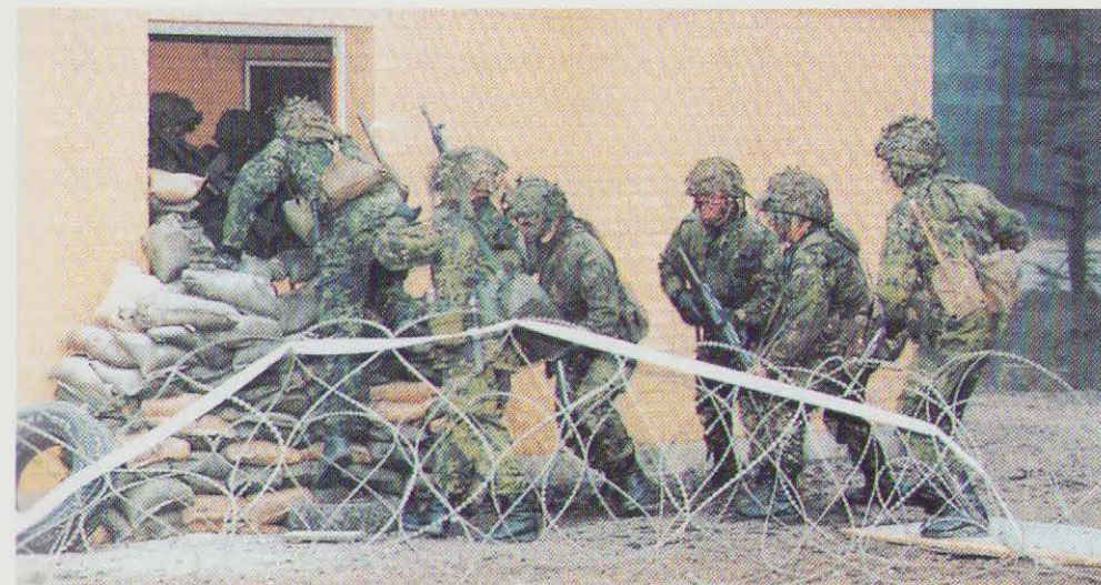
Bytræningscenteret »Brikby« i Oksbøl.

26. september-12. oktober: Partnerskab-for-Fred flådeøvelsen COOPERATIVE VENTURE finder sted i danske farvande med deltagelse fra Canada, Frankrig, Tyskland, Holland, Italien, Litauen, Norge, Polen, Sverige, Storbritannien, USA og Danmark.