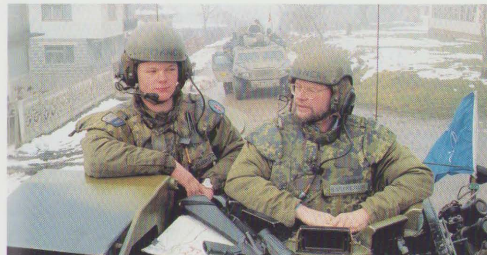
Forsvarsminister Hans Hækkerup på besøg hos de danske soldater i Bosnien.

3. juni: NATO-udenrigsministrene mødes i Berlin for at drøfte Alliancens interne og eksterne tilpasning, IFOR, opbygningen af den europæiske forsvars- og sikkerhedsidentitet inden for NATO samt Alliancens nye opgaver og struktur. På mødet fastlægger ministrene retningslinier og målsætninger for den videre tilpasning af Alliancens strukturer, herunder kommandostrukturen. Ministrene afholder i forbindelse med mødet drøftelse med den russiske udenrigsminister Primakov.