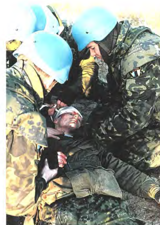
Soldater fra Estland – iført danske fragmentationsveste – hjælper »såret« kollega under træning i fredsbevarende opgaver.

Samarbejdet med disse lande er dog mindre intensivt end med landene omkring Østersøen. De indgåede samarbejdserklæringer følges