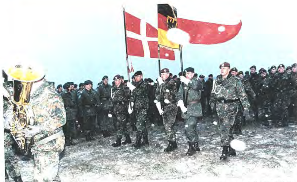
12. Polske Division, 14. Tyske Division og Danske Division har udviklet venskabsforbindelser og et ganske tæt samarbejde. Samarbejdet vil lette Polens optagelse i NATO.

dannelse, militær uddannelse og udrustning. I foråret 1996 fik bataljonen således leveret de nødvendige våben af de vestlige samarbejdslande.