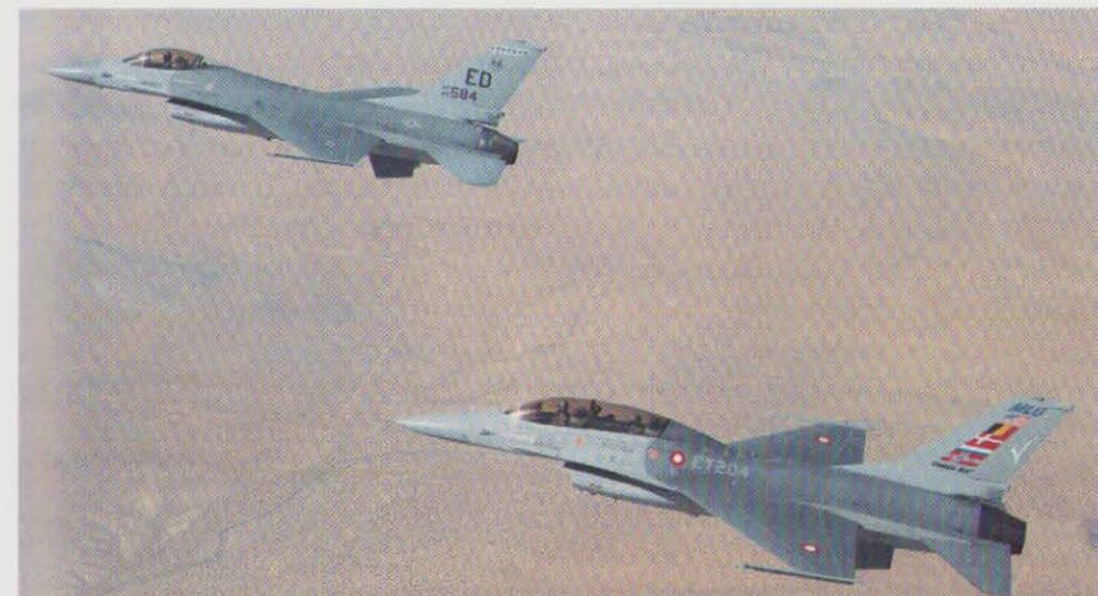
Dansk F-16 fly efter midtvejsmodifikation (MLU) sammen med amerikansk kollega over Mojave-ørkenen.

28. juni: Hovedværksted Aalborg færdiggør som første europæiske værksted Lead-the-Fleet modifikation af en F-16 i det såkaldte Mid-Life-Update program. Det markeres ved en »Roll-Out« begivenhed, hvor