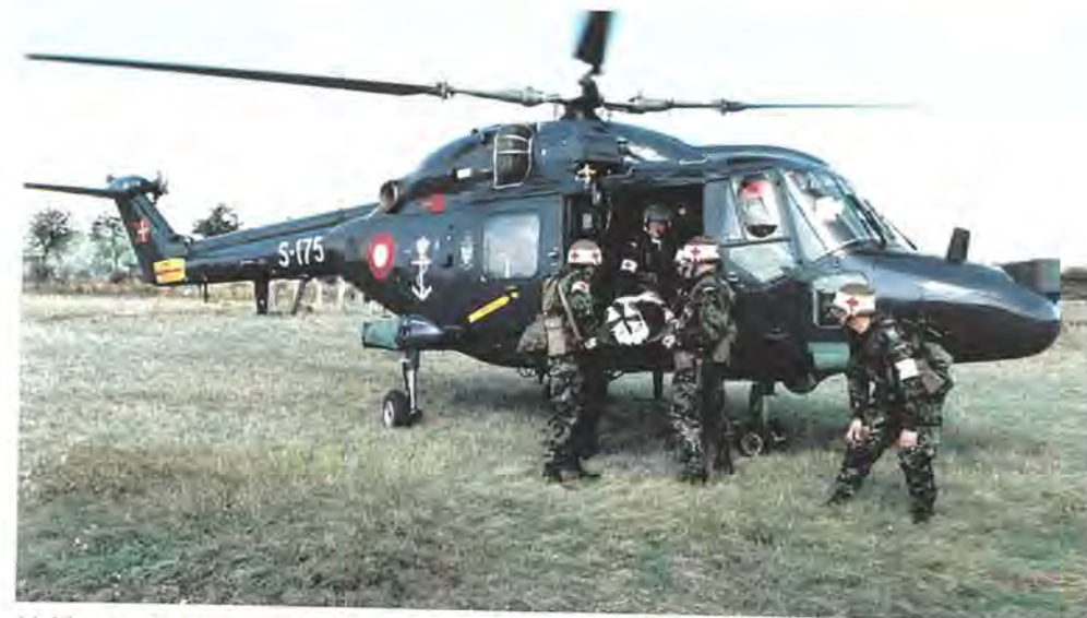
Helikopter fra Søværnet evakuerer »sårede civile« under øvelsen Baltic Circle. Øvelsen blev afholdt »in the spirit of Partnership for Peace« med styrker fra blandt andre de baltiske lande.

Opstilling og uddannelse af BALTBAT er opdelt i en række faser. I 1996 afsluttede man den grundlæggende militære uddannelse og FN-