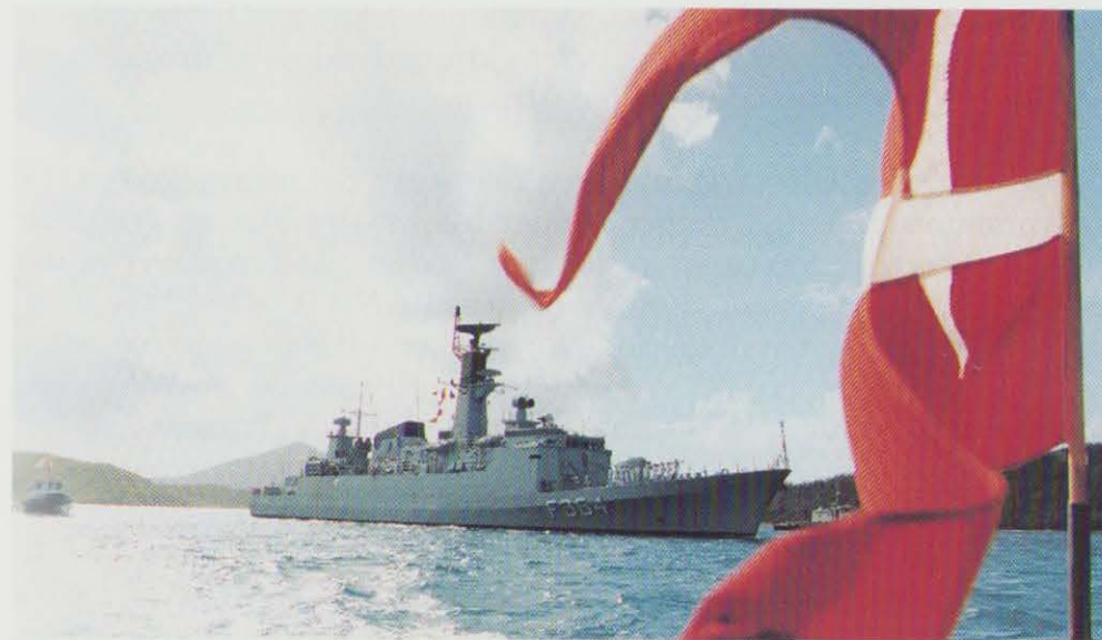
Den danske korvet NIELS JUEL anløber St. Thomas. Korvetten deltager i STANAVFOR-LANT øvelsesaktiviteter i bl.a. Caribien.

13. august: Finansudvalget tiltræder, at der fra den 14. august 1996 etableres en ny ordning, som forbedrer pensionsforholdene for overenskomstansat personel, der omkommer eller påføres varige mén under eller som følge af tjenesten i udlandet.