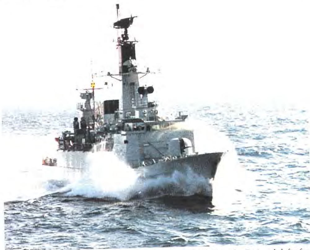
Flådeøvelsen Cooperative Venture i 1996 var endnu et initiativ under Partnerskab-for-fred (Pfp)

Samtidigt med, at Østersøsamarbejdet intensiveredes, fik samarbejdet således også en videre afsmittning. Det er i sagens natur positivt, at erfaringer fra det danske samarbejde nu kan bruges ved påbegyndelse af projekter andre steder.