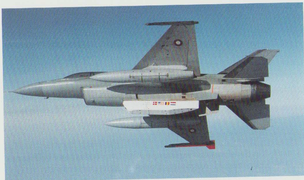
Flyvevåbnets ny rekognosceringspod til F-16 fly ligner en eksportsucces.

er fra starten så stor en succes, at der foreligger ordrer for ca. 90 mio. kr. fra blandt andet Holland, Belgien og USA.