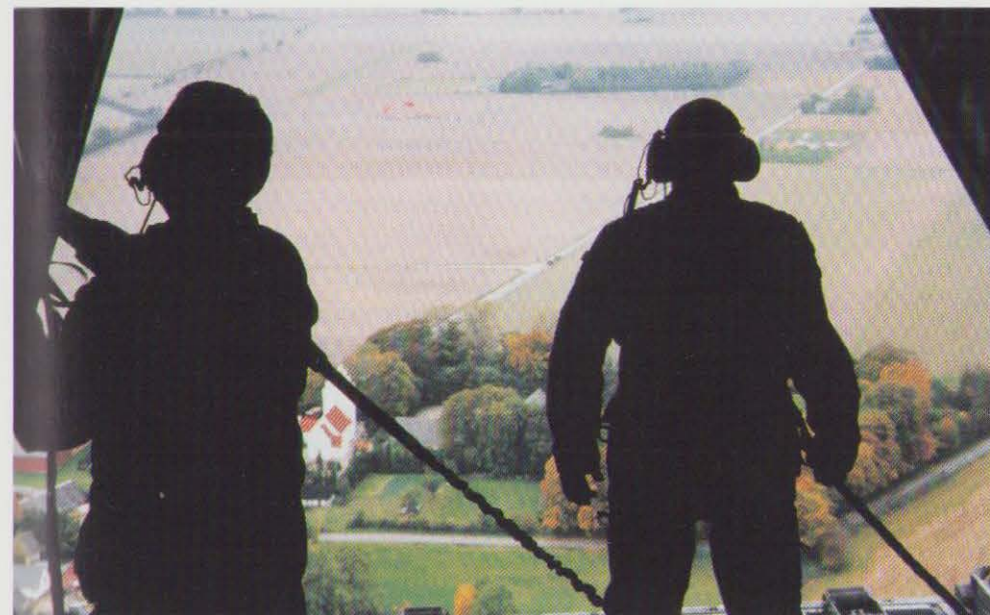
Det danske landskab set fra bagenden af en C-130 Hercules.

27. november: I fortsættelse af Aftale af 8. december 1995 om forsvarets ordning 1995-1999 fastlægges detaljerne for Forsvarskommandoens overdragelse af Søgaardlejren til Hjemmeværnskommandoen. Hjemmeværnskommandoen overtager hele Søgaardlejren og ikke kun den sydlige del af lejren som oprindeligt planlagt. Overdragelsen finder sted 1. januar 1997.