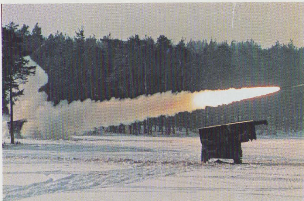
Hærens nye Multiple Launch Rocket System, der bl.a. forbedrer bekæmpelse af fjendtligt artilleri.

11. oktober: »Rapport om kriminelle værnepligtige i forsvaret« offentliggøres. Rapporten er afgivet af en af forsvarsministeren nedsat ar-