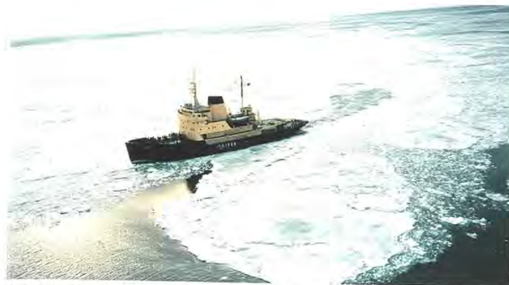
Istjenesten blev overført til Forsvarsministeriet, der med den første iskampagne i 9 år hurtigt kom på arbejde. ISBJØRN, en af søværnets isbrydere, skærer igennem.

Beslutningstidspunktet – december 1995 – betød, at der kun var kort tid til at fastlægge de praktiske detaljer i forbindelse med overdragelse af ansvaret for istjenesten til forsvaret. På tidspunktet for overførslen var der desuden en formodning om, at det for første gang siden 1986/87 atter ville blive isvinter.