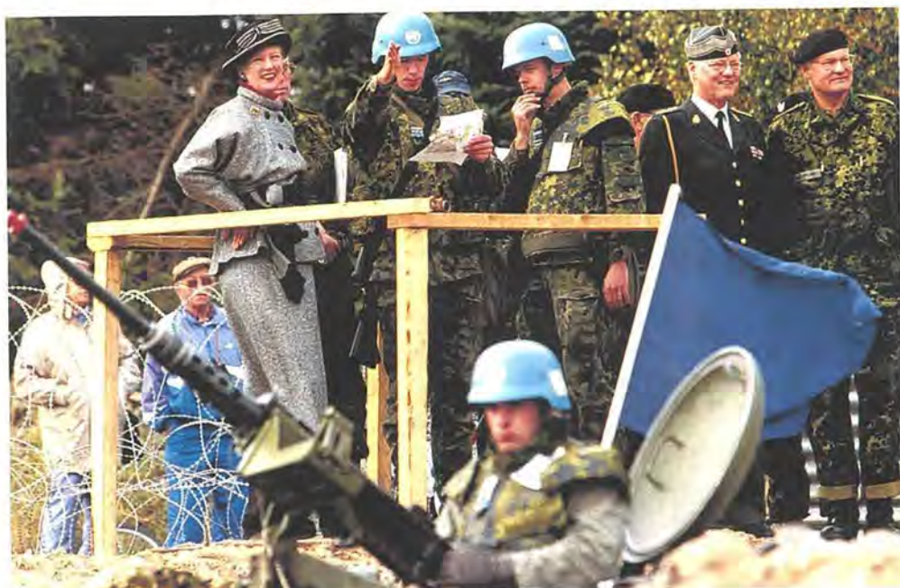
En polsk kadet orienterer Hendes Majestæt Dronning Margrethe under øvelsen Baltic Circle, hvor ni Pfp-lande trænedede fredsbevarende operationer. Øvelsen fandt sted i efteråret 1996 på Sjælland.

ske bataljon i Den Nordisk-Polske Brigade i Bosnien-Hercegovina. Soldaterne har udført tilsvarende opgaver som deres danske kolleger og har herigennem opnået konkrete erfaringer, som kan anvendes i opbygningen af deres nationale forsvar. De baltiske stater har gennem deltagelsen i IFOR desuden vist, at de ikke blot selv har brug for sikkerhed, men også vil og kan bidrage hertil på internationalt plan.