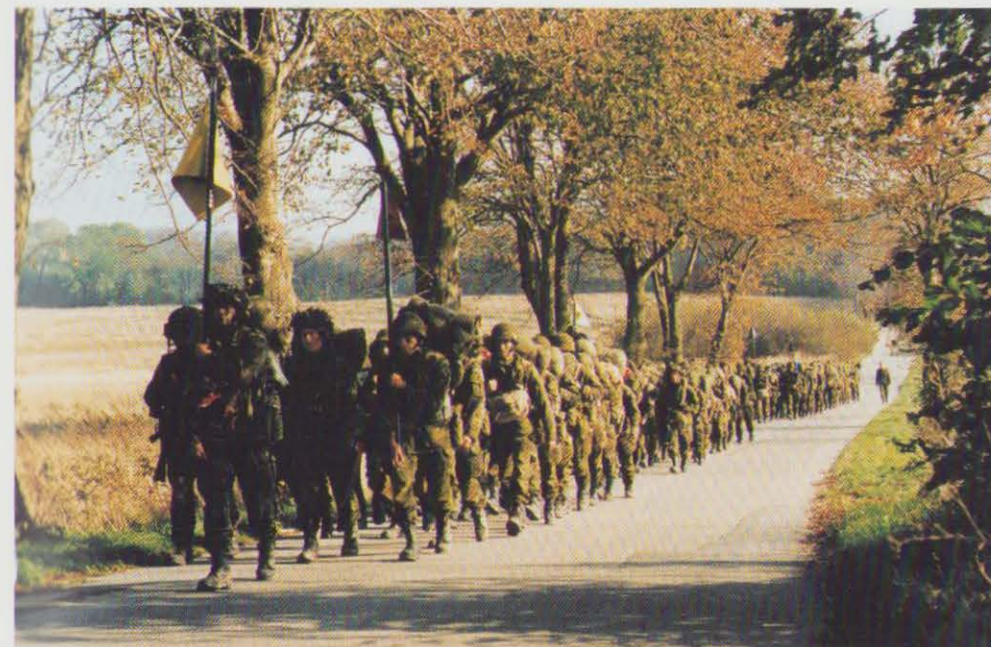
Et kompagni fra Sjællandske Livregiment afslutter de første tre måneder med »Musketærturen«.

gien skal sikre, at informationsteknologien fastholdes som et dynamisk redskab for Forsvarsministeriets virke, således at man sikrer en bedre anvendelse af ministerområdets menneskelige ressourcer samt optimal udnyttelse af de rådige tekniske og økonomiske ressourcer. De grundlæggende principper i IT-strategien er, at Forsvarsministeriets informatiksystemer fremover i langt højere grad baseres på standardprodukter, og at der opbygges en fælles arkitektur, som muliggør afvikling af koncernfælles applikationssystemer.