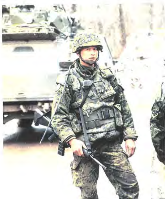
De danske soldater har modtaget mange roser fra IFOR's militære ledelse. Soldaterne har blandt andet overvåget separationszonen mellem parterne og ydet støtte til OSCE i forbindelse med valget i september måned.

i den forbindelse ydet en stor og professionel indsats og er adskillige gange blevet rosende omtalt af IFOR's militære ledelse.