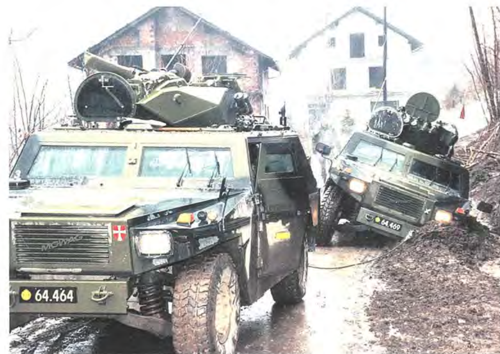
Det danske bidrag til SFOR forventes at være endelig på plads i april 1997. Der vil som hidtil indgå mindre enheder fra de baltiske lande i den danske bataljon.

SFOR udsendes i lighed med IFOR efter mandat fra FN's Sikkerhedsråd under henvisning til FN-pagtens kapitel VII. Sikkerhedsrådet vedtog SFOR's mandat den 12. december 1996, og få dage senere traf NATO-rådet den formelle beslutning om at lade den nye styrke afløse IFOR. Afløsningen fandt sted den 20. december 1996.