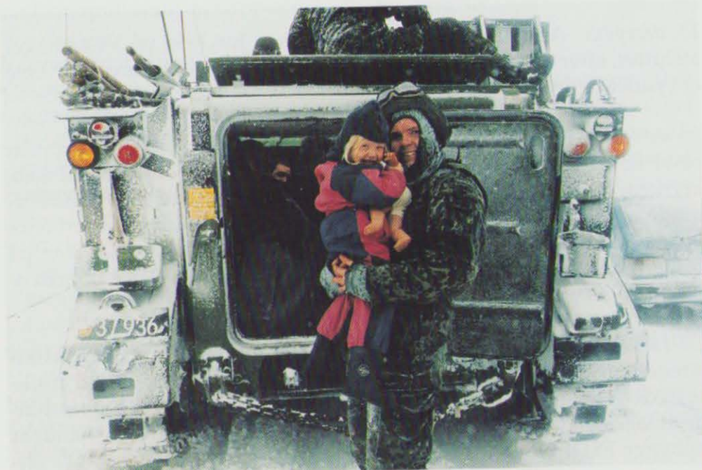
Pansret mandskabsvogn og soldater giver en hånd og et lift i forbindelse med den hårde vinter i februar.

20. december: Forsvarsministeriet iværksætter en overordnet strategi for ministerområdets anvendelse af informationsteknologi (IT). IT-strate-