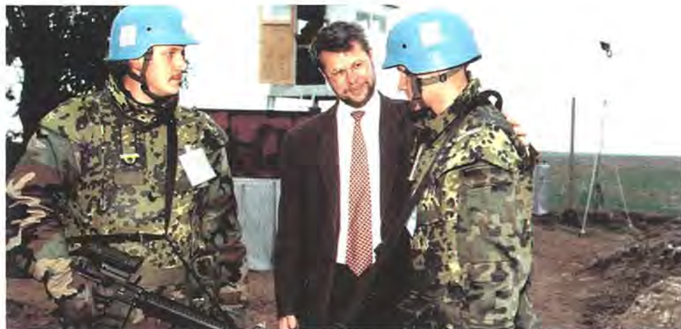
Med SHIRBRIG bliver FN fra 1999 udstyret med et effektivt redskab, der kan forhindre, at krise udvikler sig til krig. Forsvarsminister Hans Hækkerup hilser på udenlandske soldater på øvelse i Danmark.

FN har deltaget i arbejdsgruppen og ser meget positivt på det danske initiativ. Arbejdsgruppens rapport blev i marts 1996 cirkuleret i FN til underretning om, hvordan et praktisk samarbejde kunne iværksættes.