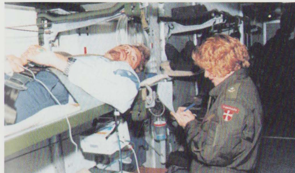
Den flyvende intensivafdeling, der består af containere i et C-130 Hercules, er en ny metode til transport af hårdt sårede.

13. december: Ammunitionsrydningsæsonen for 1996 på Vestamager afsluttes, efter at det med Ørestadsselskabet A/S aftalte areal for 1996 er ryddet og frigivet.