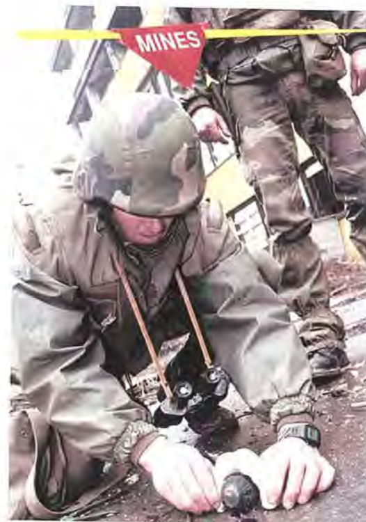
De mange landminer udgør den største fare for både civilbefolkning og soldater i Bosnien. En fransk chefsergent gør her klar til at spænge en ueksploderet granat.