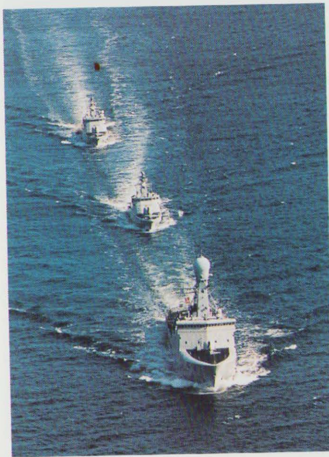
Den 3. august 1996 mistede 9 mennesker livet ved den tragiske flyulykke på Færøerne. Vædderen, medbringende bærerne, Glenten og Sværdfisken på vej til Holmen.

7. august: Hærens Materielkommando indgår kontrakt om levering af panserværnsvåben – TOW-missiler – til hæren. Anskaffelsen gennemføres koordineret med det norske og svenske forsvar inden for rammerne af Nordisk Materielsamarbejde.