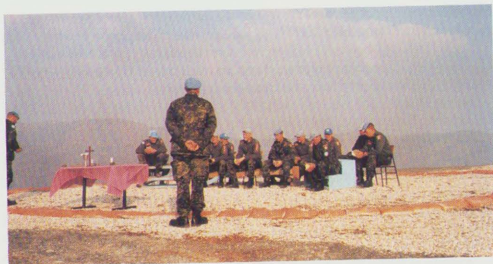
Feltgudstjeneste i Makedonien.

18. november: WEAG-forsvarsmisttermøde i Oostende. Ministrene beslutter at udbygge det eksisterende WEAG-samarbejde med etablering af en Vesteuropæisk Forsvarsmaterielorganisation, WEAO, som i første omgang får til opgave at yde støtte til WEAG's forsknings- og teknologiprogram, EUCLID.