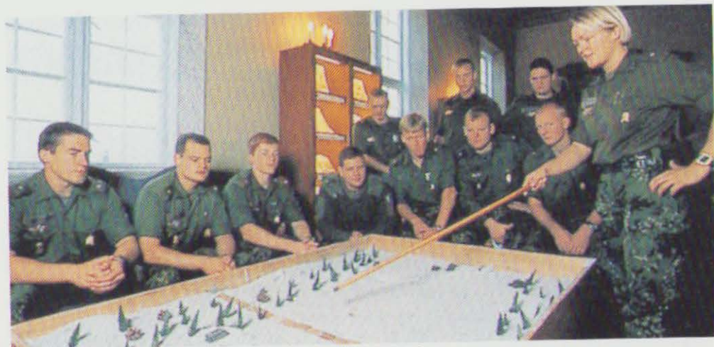
Undervisning i taktik ved terrænbordet.

23. januar: En dansk Leopard kampvogn i Bosnien-Hercegovina påkører fire panserminer og bliver svært beskadiget. En soldat kommer lettere til skade.