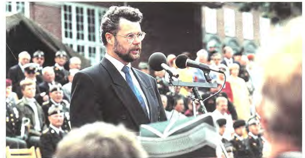
Forsvarsminister Hans Hækkerup.

Vores indsats har ikke været uden omkostninger. To danske soldater mistede livet i Bosnien i 1996. Forsvaret blev i 1996 også ramt af den