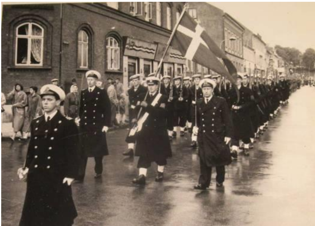
Vist nok Fredericia

Og jeg kom med en kammerat på weekend i hans hjem i Vejen, hvor lørdagen bød på diletant i det lokale forsamlingshus med ”Vi som går køkkenvejen”.