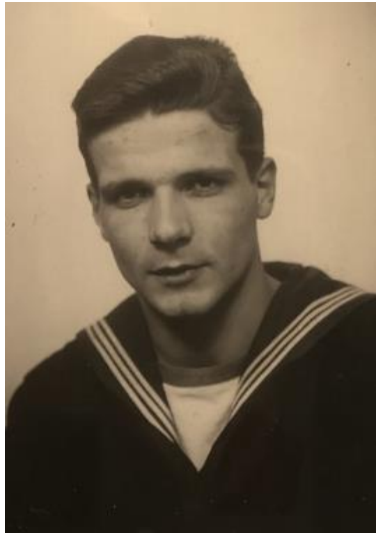
1955: Værnepligtig 24 27 14

I februar 1956 skulle vi have været til Norge, men blev fanget af tyk is og blev tvunget til at gå til Lillebælt og Fredericia havn den 9. februar. Vi kom først fri den 5. marts. Det var en hård vinter med frostgrader i slutningen af 20-erne.