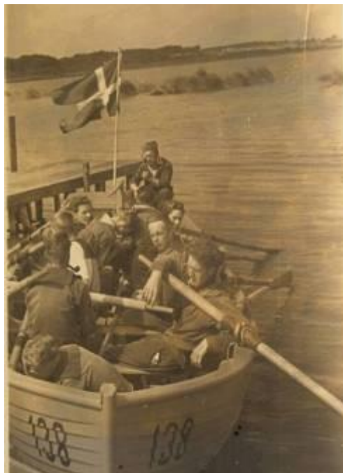
Travalje på Arrehavet