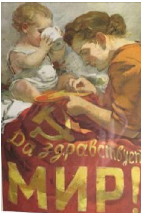
MIR: Verden – Fred.

Gave fra venlig mand – bagpå :”Ich gratulire sie mit oteur Besuchen Leningrad gruten sie freundshaft fólker sozition” ? + svært læseligt navn.