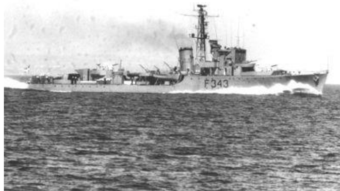
F 343 "Valdemar Sejr".

Flåden havde endnu to skibe af klassen, nemlig "Esbern Snare" (F341) og "Rolf Krake"(F342). Skibene var små fregatter, benævnt "Hunt II Fregates". Byggede omkring 1941 af Swan Hunter, Wallsend, GB. Der var ingen luksus. Konstruerede og anvendt til at jage u-både. (De fleste af os basser (menige) sov i hængekøjer med tæpper og "madrasser", som var lange rumopdelte poser med stropper og fyldt med korksmuld, så de kunne bruges som "redningsveste".)