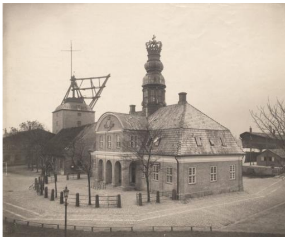
"Under Kronen" og "Mastekranen".

huse "Under Kronen" (en smuk lille bygning på Holmen). Der kunne jeg henvende mig, hvis jeg ville have en chance for et andet forløb i det kommende år. ("Join the Navy and see the world – all you see is the sea")