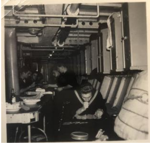
Forbanje på Valde. Der står en sammenrullet køje t.h., som om natten var rullet ud og surret op i bøjlerne ovenfor ved siden af andre køjer.

”Valdemar Sejr”s bemanning 1955 – 1956 var virkelig en blandet forsamling.