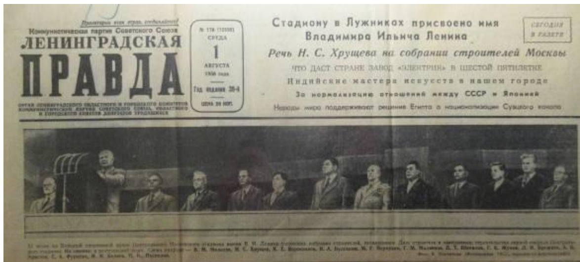
1. AVGUSTA 1956: Leningradskaja PRAVDAs forside og med billede og omtale af os på flot bagsideplads.