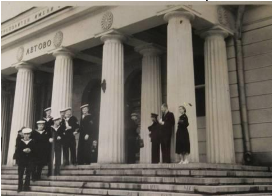
Leningrads flotte AVTOVO metrostation.

Derefter prøvede vi Metroen, som er noget af det mest overdådige, jeg nogen sinde har sét. Hver station er et tempel.