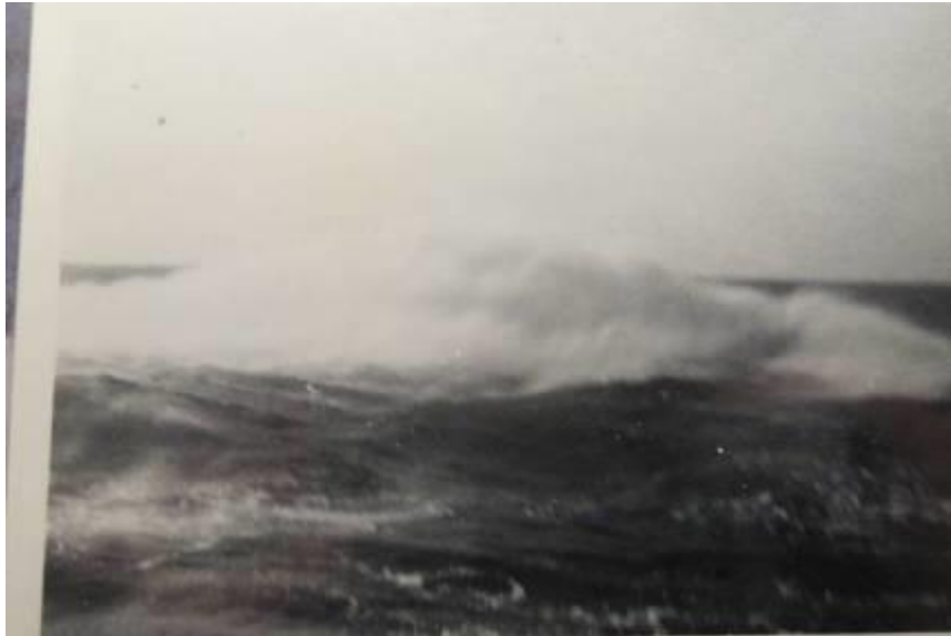
Dette og næste billede: Sildefiskeri ved Bornholm.