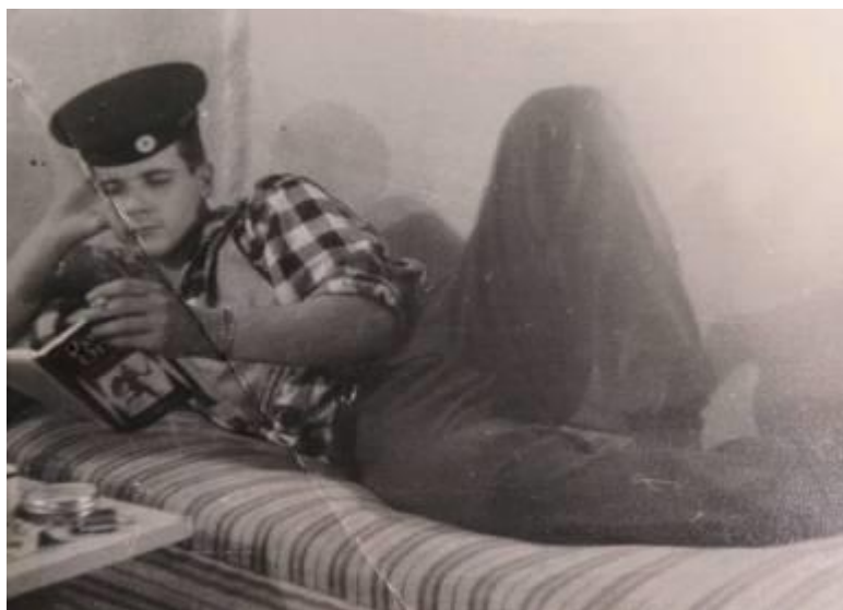
Fri lørdag/søndag. "Røde Orm" på Hestetangsvej, Farum.