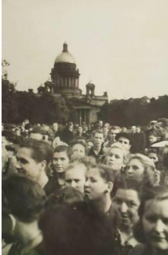
Isak katedralen. I forgrunden autografjægere og lyttere.

I går havde vi vor første dag i Leningrad. Hele formiddagen stod folk på kajerne og ventede på, at vi gik i land. – Da vi gik i land, var de helt vilde med at komme i kontakt med os, røre ved vort tøj, bytte mønter, cigaretter, tændstikker, emblemer o.l.