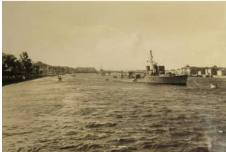
Vi lå for bøje på Nevafloden.