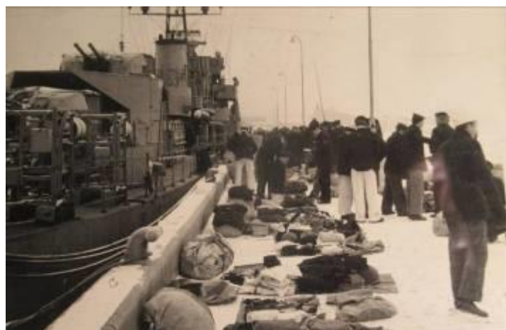
Tøjmønstring på frossen kaj i Fredericia.

Så vi kom til at kende Fredericias værtshuse med dansende piger. Og kom på orienteringsløb på Trelde Næs med de lokale soldater.