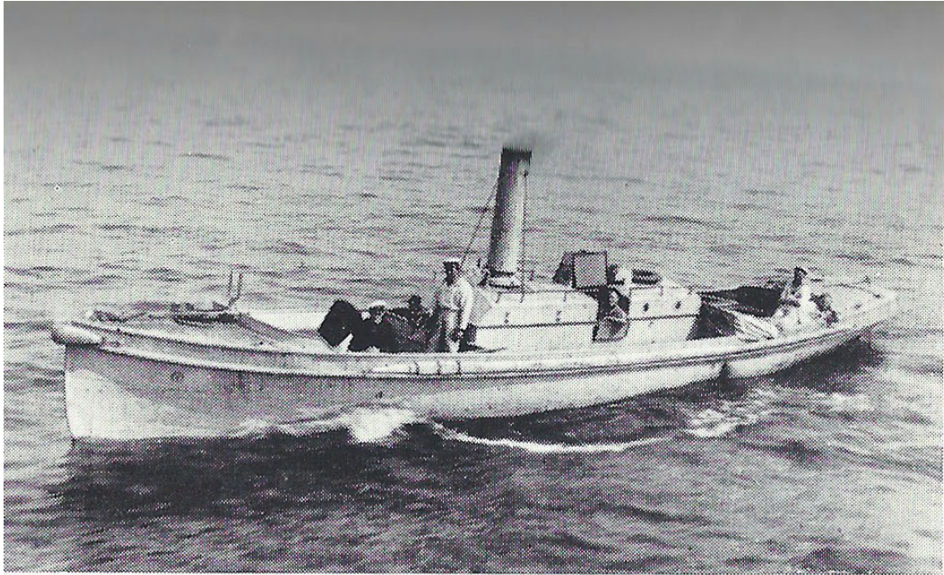
Vedetbaaden (Dampbarkasse I Klasse). Længde 15 m