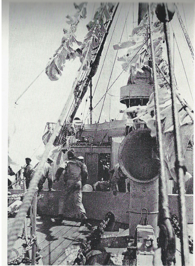
Jollerne med flagrende Vasketøj. (Forneden Bakkens Bølgebryder)