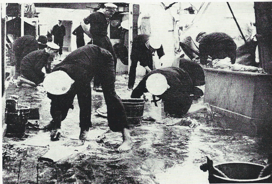
Skurebørste var et af Hjælpe midlerne!