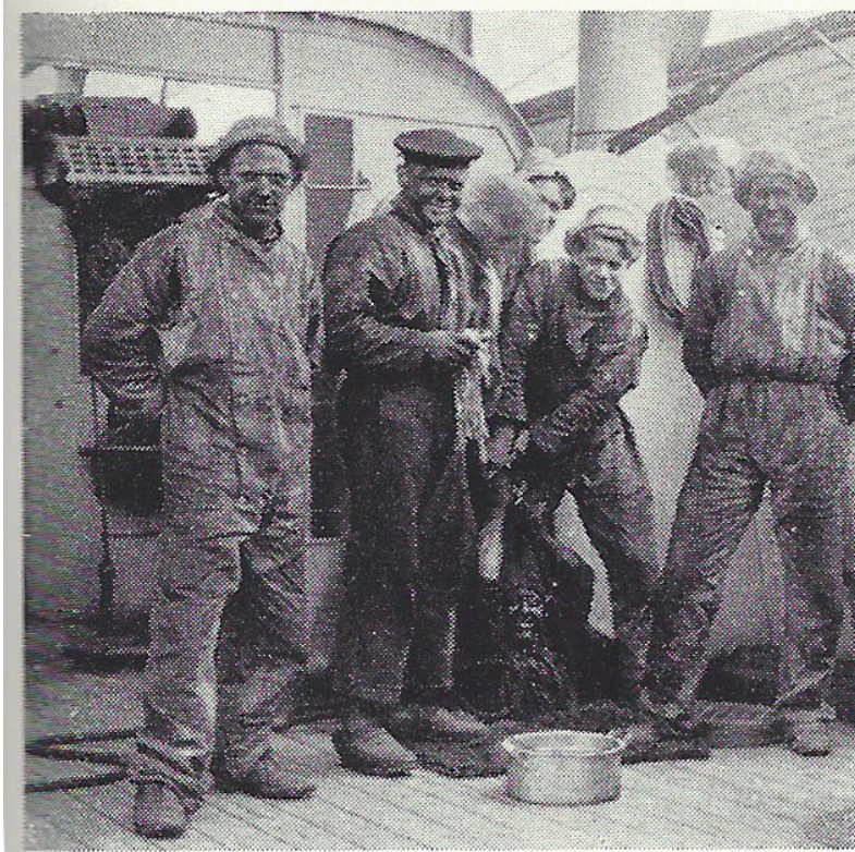
Kullempere. En Mand fires ned i Kul- kasserne