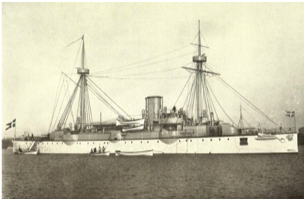
Skolen i København.

Den 10nd September 1899, stillede vi i København på broen over til Orlovsværftet og kort efter, kom der en underkanon og førte os gennem vagten og ned til Holmens Kanal. Derfra blev vi efter først at have været inde på Beklædningsmagasinet og skiftet tøj og fået en stor ransel med de respektive stykker tøj vi for fremtiden skulde gå i og vort eget i en pose. Og så var vi soldater. Vi fik fint middagsmad kl. 4 om eftermiddagen, men vi havde heldigvis forsynet os med en god frokost på soldaterhjemmet før vi gik derind. Så begyndte der en måneds fangenskab, hvor vi i vores fritid og når der var regnvejr var indelukket i det gamle kaserneskip Jylland og ellers kom ind på Nyholm og trave og marchere og fægte ligesom det kunde træffe sig. Det var kedeligt mange gange, men om aftenen når lanternerne blev tændt gik det tit lystigt med leg og dans til tonerne af en mundharmonika akkompagneret af fløjten i fingrene, som en Københavner var særlig øvet i. Da vi havde været på skolen en 14 dages tid fik vi nogle timers landlov til at gå i land, med vores civile tøj, og det var også det eneste jeg fik udrettet den