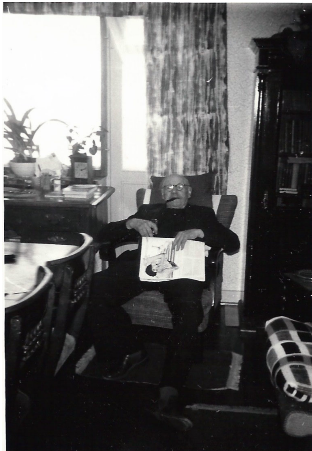
Farfar som jeg husker ham da han boede hos os.