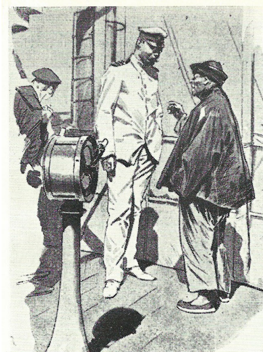
1900. Kinesisk Lods til Prins Valdemar : »You come take piece of country?«

var så vidt vi kunne se rund og høj i Midten og bevokset lige til toppen med de nydeligste lysegrønne palmer den lignede en vældig buket. Siden har vi set flere og nu har vi Indiens kyst om bagbord hele tiden. Den ser meget frugtbar ud at dømme efter de store palmeskove langs kysten medens vi i baggrunden ser bjerg toppene hæve sig op over det øvrige landskab. Hele tiden dukker der nye scener op efterhånden som vi når frem. Det bliver nok en smuk jul her, men til hverdag er det også drøjt nok. Jeg må snart til at skrive julebreve, men i aften vil jeg vaske tøj.