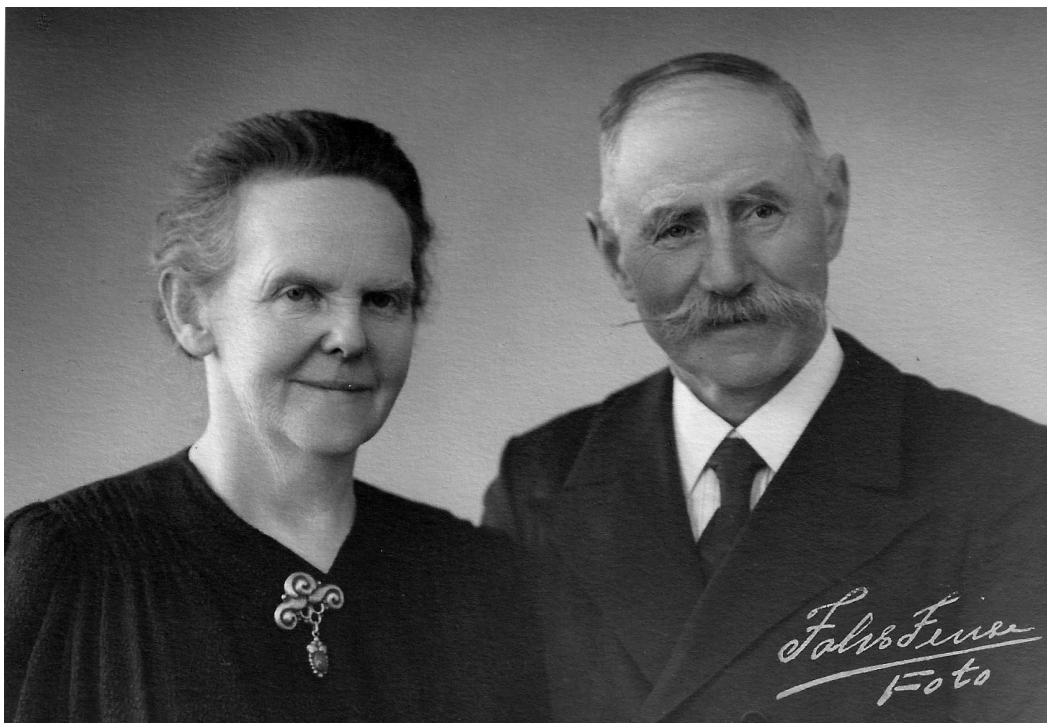
Farfar og Farmor 1 May 1942