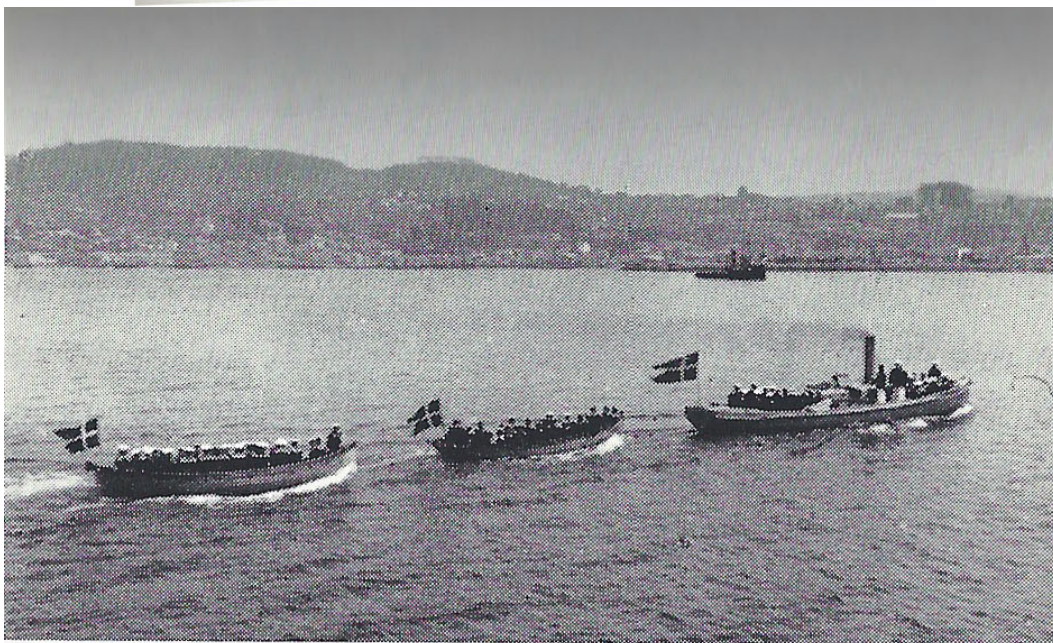
Vigo. Landlov. Travailler bugseret af Vedetbaaden