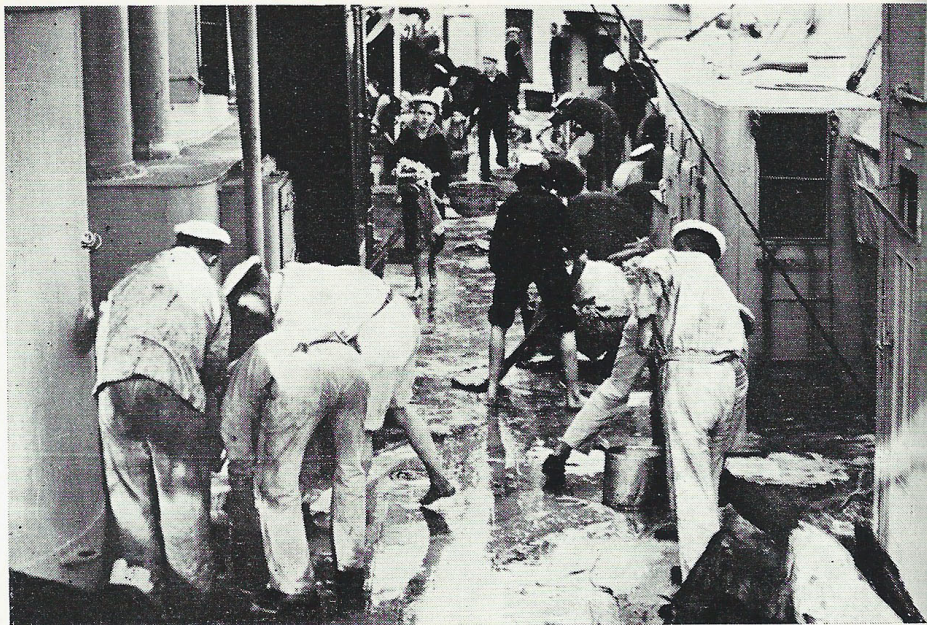
Mandage vaskedes Tøj paa Dækket, her i Bagbords Side – og