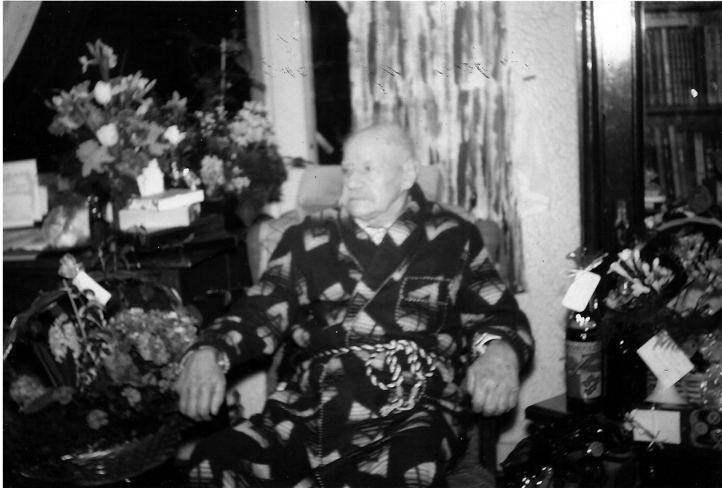
Farfars Fødselsdag. Ikke sikker på hvilken fødselsdag det var men han var enten 85 eller 90.