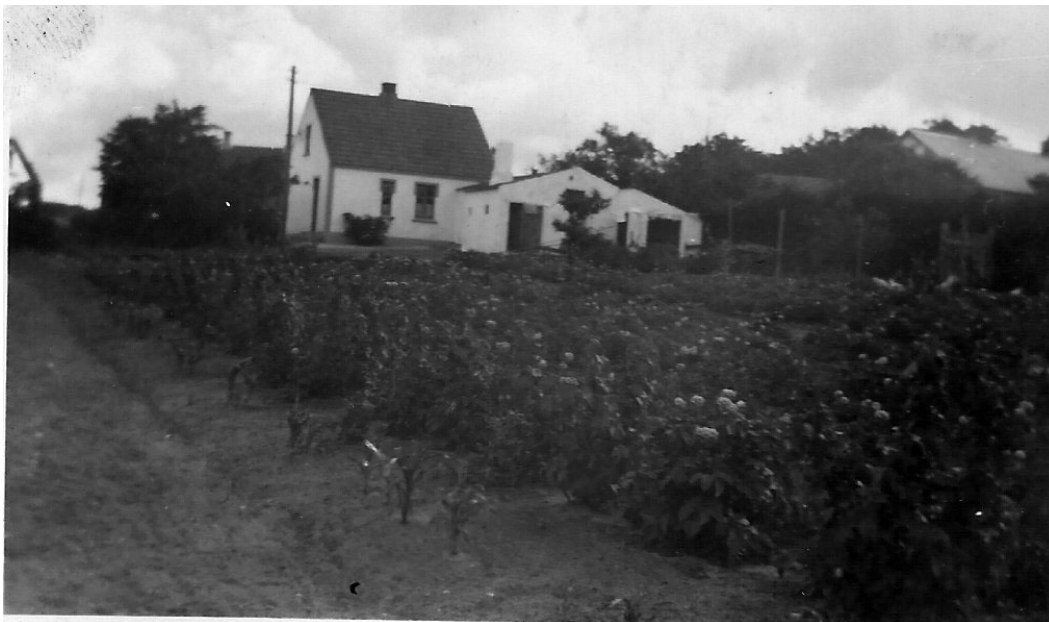
Farfars hus og have i Bording

hjerneblødning og hun skulle holde sig i sengen i ro og ikke for lyst i fjorten dage. Så mente han at det skulle gå i orden igen. Og det gjorde det også, men han sagde at hun skulle være forsigtig ikke at overanstrengte sig eller bryde hovedet med noget, og da jeg vidste at hun ikke kunne lade være at spekulere eller tage fat, bestemte vi os til at sælge gården og købe os et hus. Det var vel tidlig for der var ikke liv i handelen, men omsider fandt mægleren en køber. Det var et par unge folk. Han havde været ved banen og havde et hus i Herning, som jeg skulle tage i bytte og så måtte jeg lade 10.000 kr. stå i to private noter. Hans far og jeg stod hver for 1000 kr. Det viste sig at være en dårlig køber og vi måtte et par gange betale renter for ham. Til sidst måtte vi opgive og drive ham til at sælge frivilligt eller blive erklæret konkurs da hans far ikke ville ofre flere penge på gården. Med besvær fik vi en køber, der kunne ordne det mod at jeg lod 8.000 kr. stå i gården til den blev solgt igen og så gik den gennem flere ejere og hver gang der skiftedes fik jeg 2000 kr. Af de indsatte penge. Så jeg efterhånden fik alle mine penge ind og huset i Herning solgte jeg og tjente 500 kr. Vi købte så et hus i Bording for 8.500 kr. Med stor have til og så havde vi huset i Silkeborg til 23.000 kr. Der var kredit lån og statslån og det var lejet ud hele tiden. Vi kunne ikke selv flytte derned, da Julie ikke kunne gå op ad trapperne.