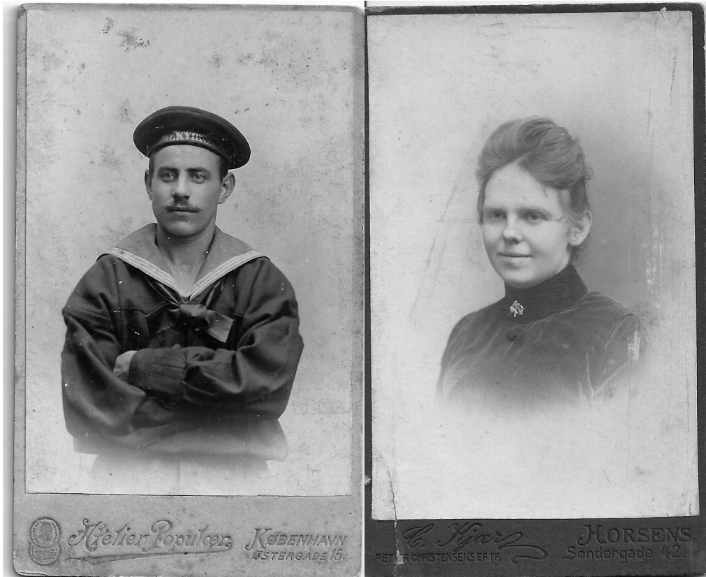
Farfar efter Valkyriens togt.