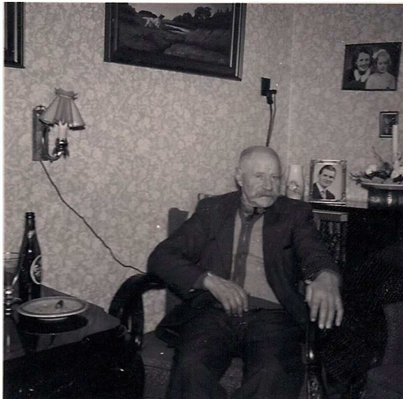
Farfar i 80 års alderen.