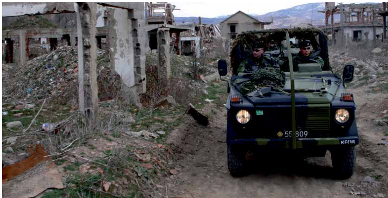
Danske NATO-soldater på patrulje på Balkan. Det var her Forsvaret fik de første erfaringer med veteraner.

Danmark er i løbet af to årtier blevet et land med veteraner. Mange veteraner vender tilbage og genoptager deres dagligdag igen, men nogle kommer også hjem med skader på krop eller sjæl. Det er dem, dette tema handler om.