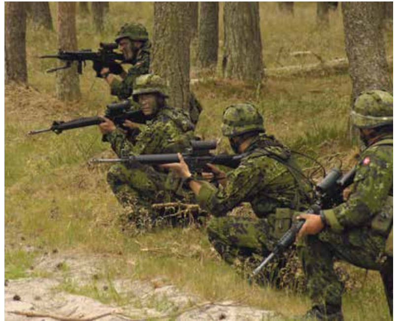
Der kan køres frem til et afsideområde, og så er det ellers til fods resten af vejen, hvis man da ikke vælger at køre i kolonne i kampvognsspor.