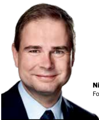
Nicolai Wammen Forsvarsminister