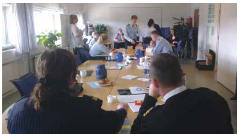
2. Eskadrens Lean-projekt startede med to workshops, hvor medarbejderne skrev alle deres arbejdsprocesser på en lap, som blev hængt på væggen. Det gav overblik og mulighed for at trimme flowet i processerne.

Lean handler om skabe mere værdi ud fra kundens synspunkt. Det sker blandt andet ved at skabe flow i arbejdsprocesser, fjerne spild og stræbe mod det bedste resultat gennem løbende forbedringer. Der er oprettet et Lean-kompetencecenter i Forsvarsministeriet, der skal støtte og udbrede et systematisk arbejde med Lean hos myndigheder i Forsvarsministeriets koncern. Centret har uddannet omkring 600 medarbejdere i Lean. Lean-kompetencecentret kan kontaktes med ideer til og iværksættelse af Lean-projektforløb på fmn-ktp-lean samt fmn@fmn.dk