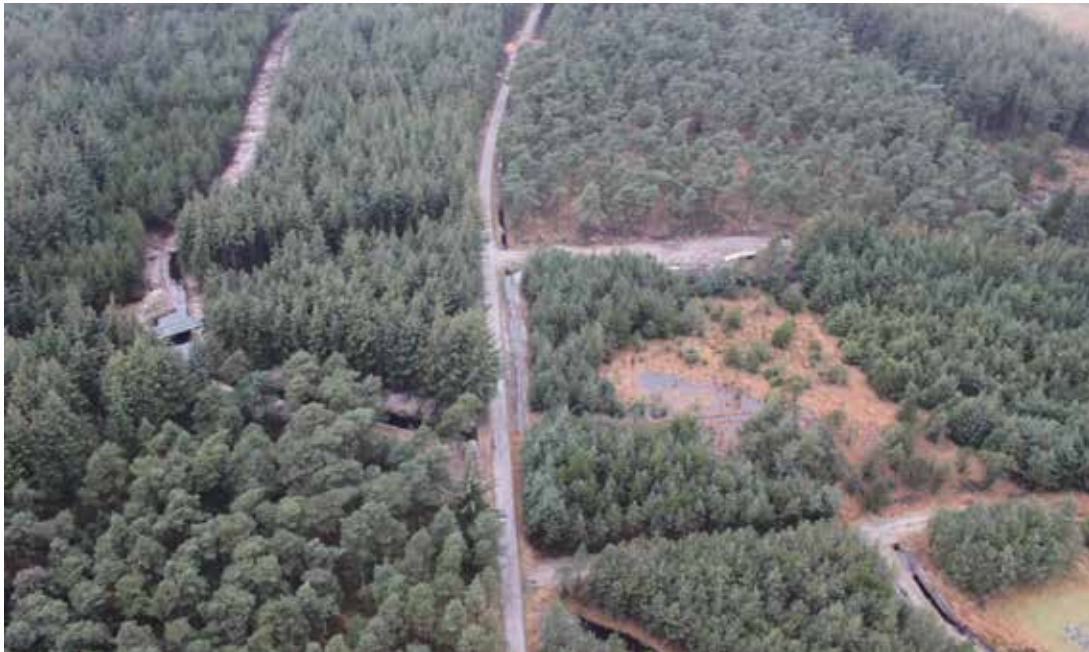
Skovkampbanen giver rig mulighed for at øve ild og bevægelse, fordi terrænet er uoverskueligt og observationsafstandene er meget korte.