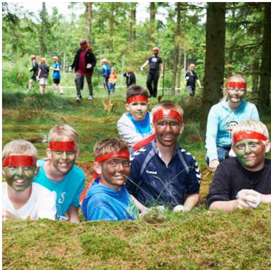
Sportspraktikdagen har været en tradition i Viborg Kommune gennem 25 år. Counter Strike rekorden er i hus.

Flyvestation Karup var rammen om Sportspraktikken i juni 2013, hvor 717 elever fra Viborg Kommunes 5. klasser prøvede forskellige idrætsgrene. Det hele sluttede med et kæmpe counter strike-slag, hvor melbomber fløj gennem luften mod terroristerne, der forsvarede de orange pointkegler.