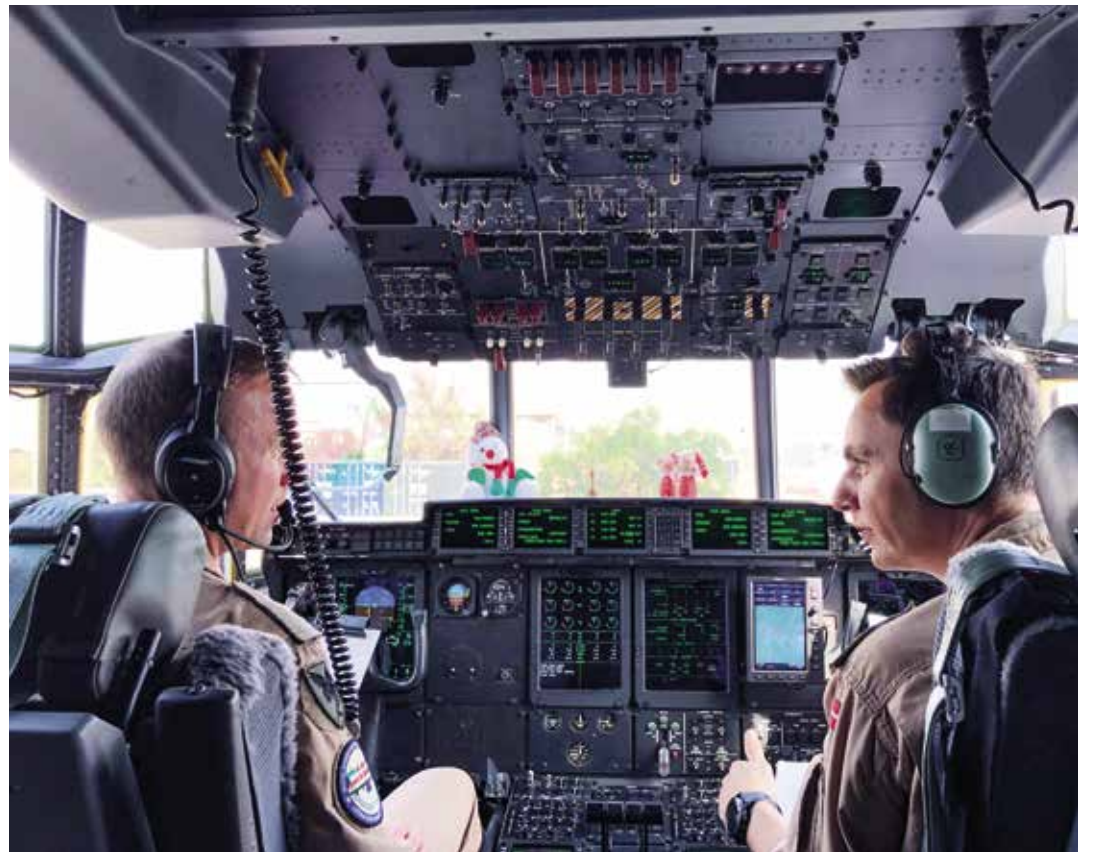
G-130-bidraget, som i øjeblikket er udsendt til Operation Inherent Resolve (ORI), mærker også julestemningen med en maskot i cockpittet.