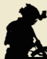
Ved hjælp af specialværktøj skaffer en special operations combat rescue technician adgang til en kører, der er fanget i pansret køretøj.