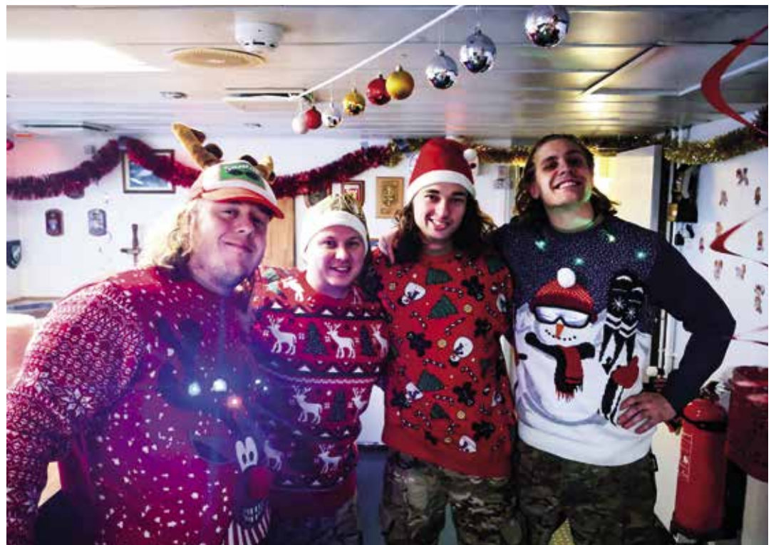
Besætningen på inspektionsskibet "Hvidbjørnen" giver den gas med julepynt og juletøj.