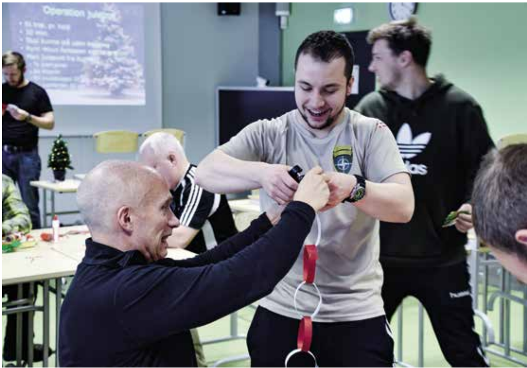
Hos de cirka 200 danske soldater udsendt i enhanced Forward Presence (eFP) i Tapa i Estland er man i fuldt sving med at lave julepynt og komme i julestemning.