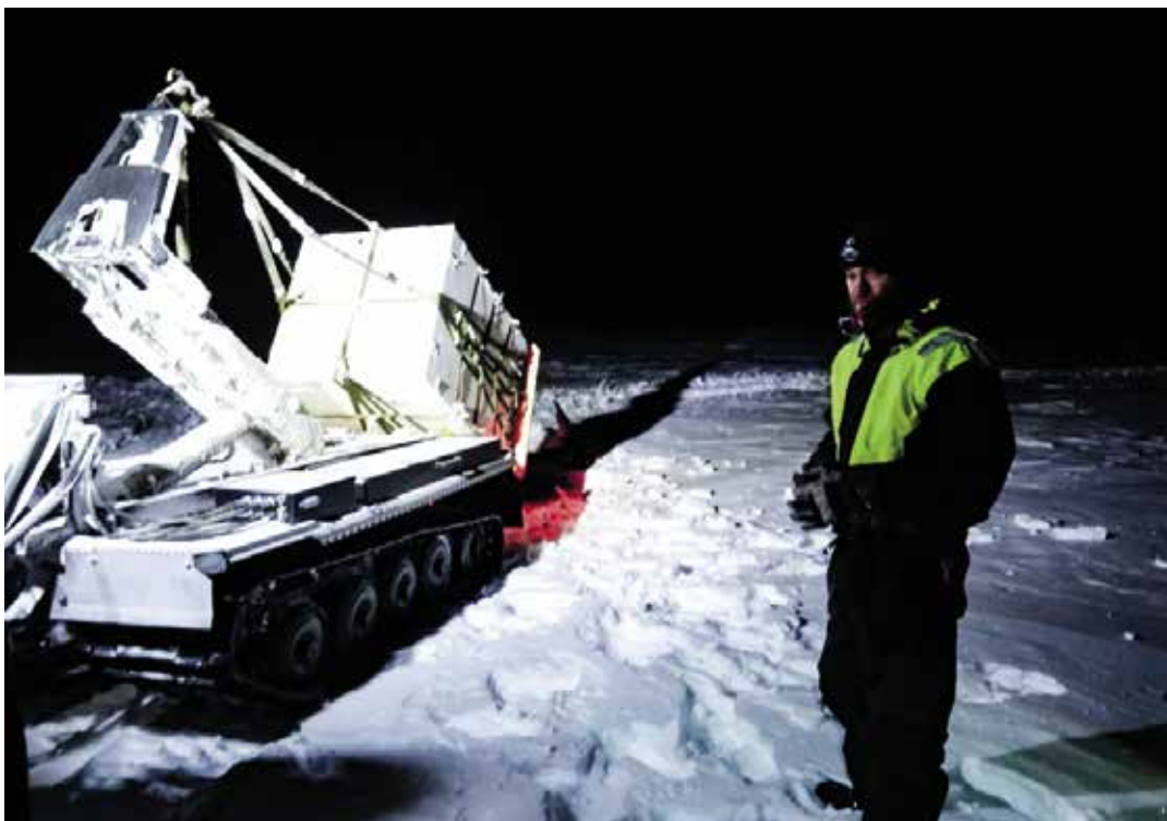
På Station Mestersvig på Grønlands østkyst har de to stationsspecialister, også kaldet "ugler", modtaget julemad og andre gode sager med post fra luften, fra et af Flyvevåbnets Hercules-fly under det årlige "juledrop".