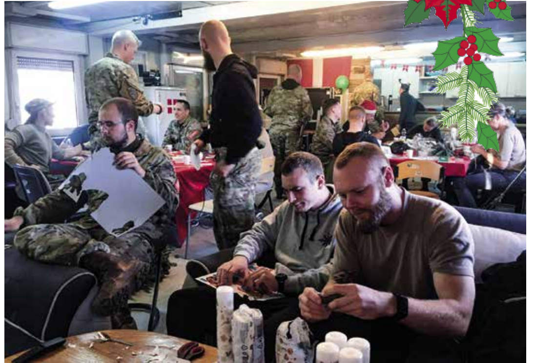
Hos soldaterne i KFOR i Kosovo blev julen skudt i gang med besøg af julemanden, som kom midt om natten med julesokker til alle mand samt lidt snacks og en invitation til klippe-klistre-dag den første søndag i advent.