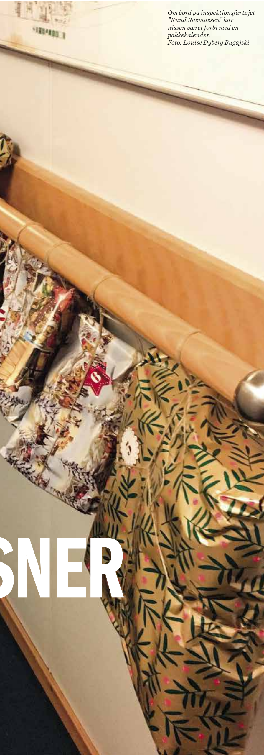
Om bord på inspektionsfartøjet "Knud Rasmussen" har nissen været forbi med en pakkekalender.