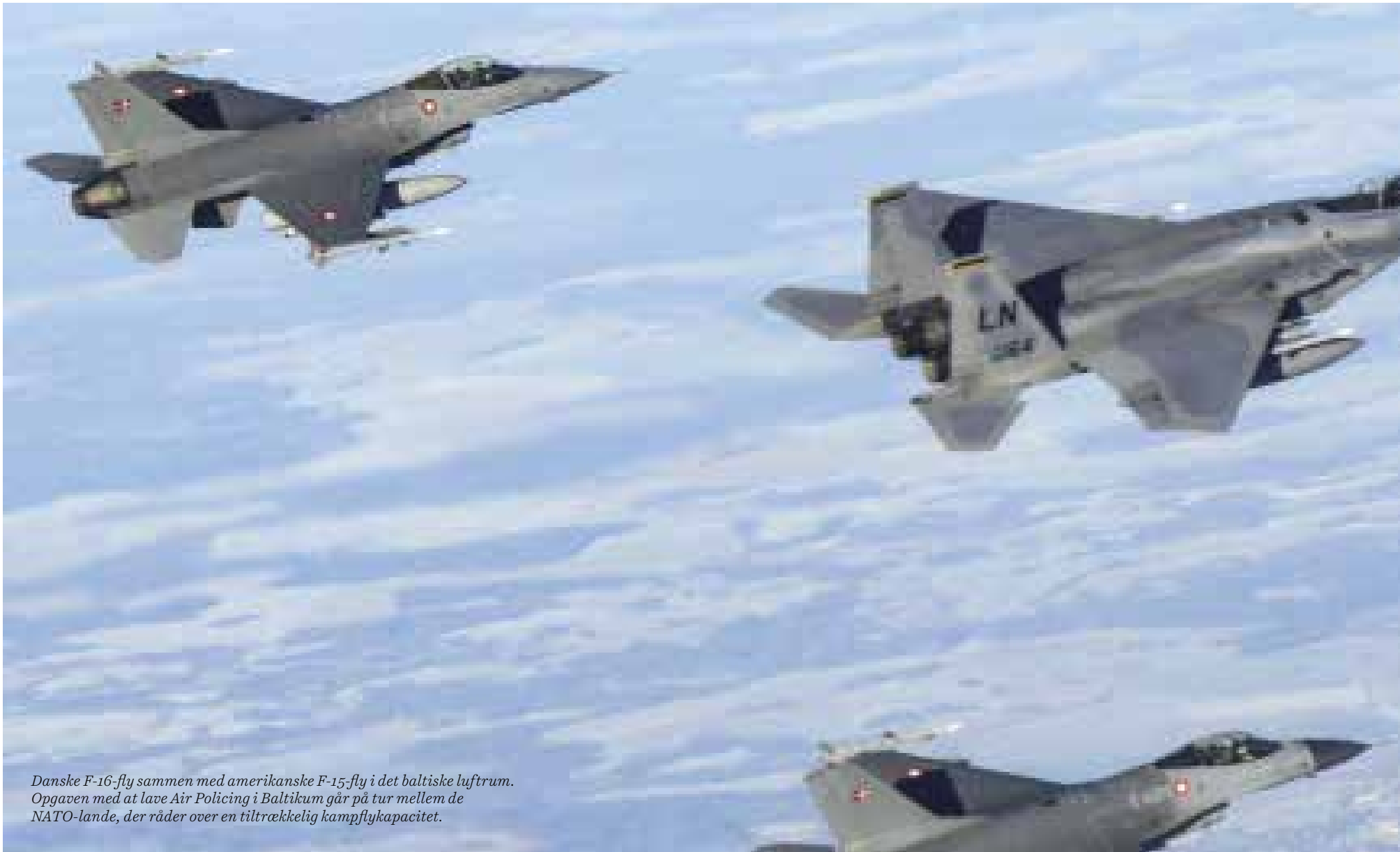
Danske F-16-fly sammen med amerikanske F-15-fly i det baltiske luftrum. Opgaven med at lave Air Policing i Baltikum går på tur mellem de NATO-lande, der råder over en tiltrækkelig kampflykapacitet.