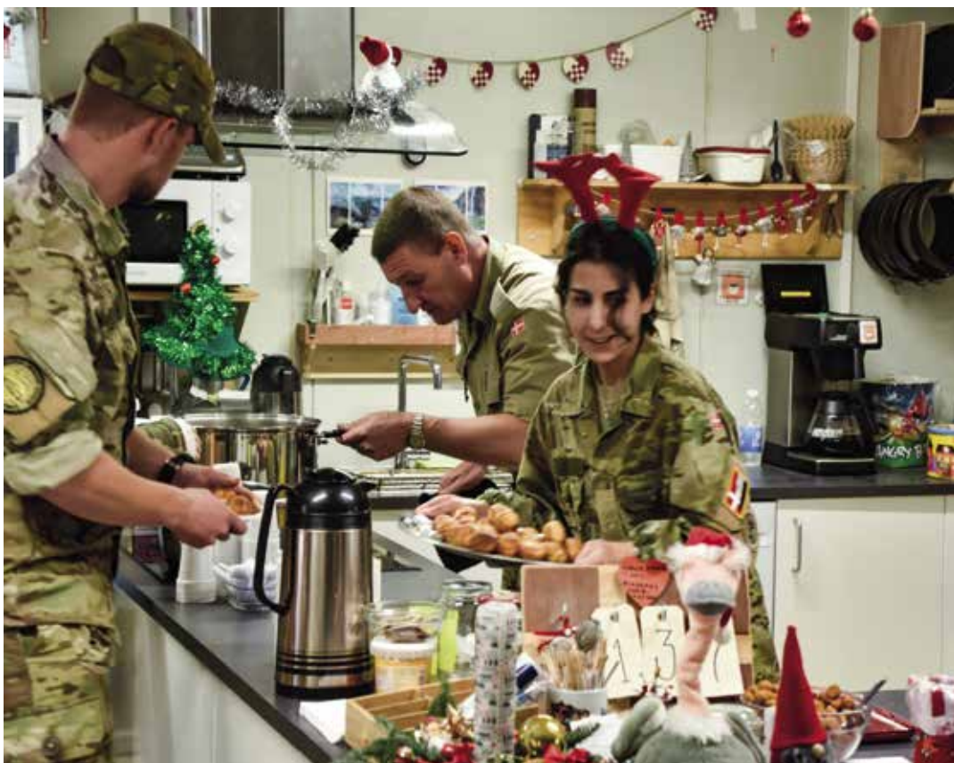
Også hos soldaterne udsendt i Operation Inherent Resolve (OIR) i Irak bliver der talt ned til jul med æbleskiver, nisser og kalenderlys.