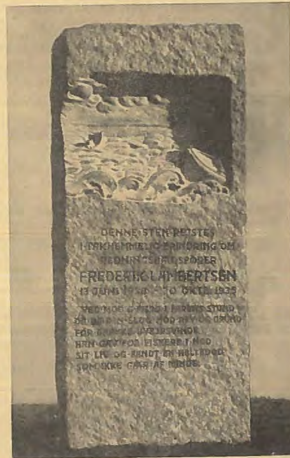
Indskriften paa Stenen var følgende:

Medens alle i den store Forsamling blottede Hovederne, faldt Dækket for Stenen, og man saa den smukke kraftige Granitsten med det symbolske Relief af en Redningsbaad, der stævner frem gennem Brændingen. Det prægtige Monument er udført af Billedhugger Billeskou, Esbjerg, og Relieffet er modelleret af Billedhugger Elo, København.