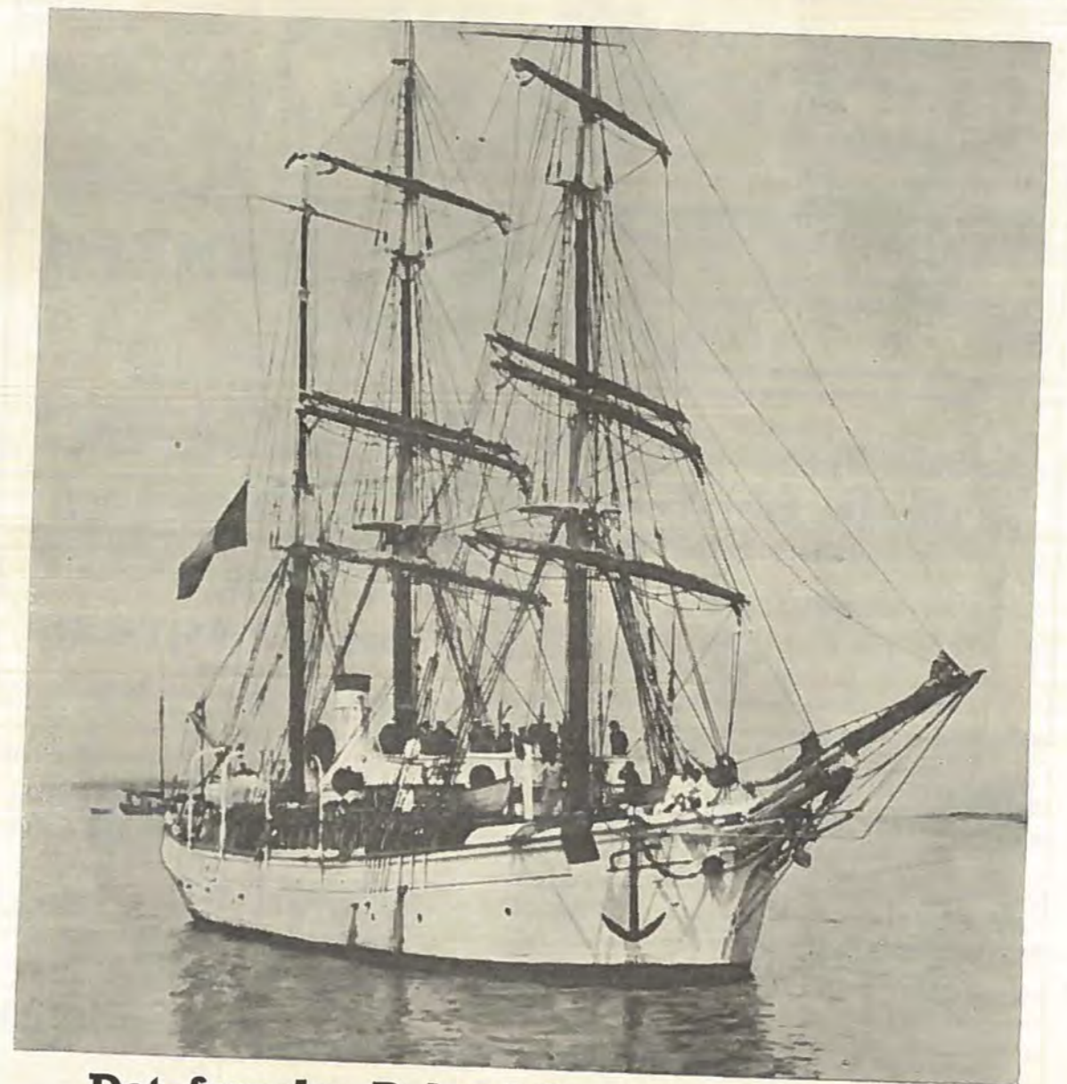
Det franske Polarskib »Pourquoi pas«